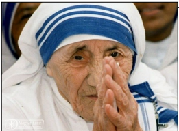
Kalkuttai Szent Teréz szűz

látását”, de mi tudjuk azt, hogy az valójában mások jóindulatának megszerzésére törekszik, az igazságtól messze van. A tanulságot azonban érdemes meglátni: mennyi minden megtesz sok ember, hogy ügyesnek, okosnak, előrelátónak... bizonyuljon – közben nagyon meglehet, hogy a lényeg marad el, ami arról szól, hogy az Isten akarja az ember javát, de nem így! – Ő „az isten- és emberszeretet parancsában” foglalja össze, ami a javunkra válik. Az pedig arról szól, hogy az igazi értékek az örök értékek, a földi javak segíthetnek abban, hogy igazán gazdagodjunk: „sok embert áldottak már azért, mert szeretete és segítette a szegényeket, aki örömet talált abban, hogy másokkal jól tehetett...” – hogy mindig mindent jól tudjunk tenni, fontos gondolatot köt a lelkünkre a szentmise egyetemes könyörgése: „Urunk, Istenünk, Te szolgálatodba fogadtál minket és nagy értéket bízál ránk! Add, hogy egész szívvel szolgáljunk Neked és a ránk bízott javakat a Te szent terveid szerint használjuk!” – Kezeljük tehát lelkiismeretesen mind a földi, mind az örök javakat, hogy a kicsiben is és a nagyban is hűségesnek bizonyuljunk!