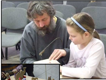
Készül a Betlehem