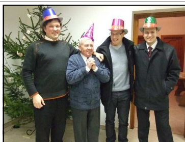
2011-es esztendőre! December hónapban a Széchenyi István Általános Iskolában énekel-tünk egy adventi gálaműsor alkal-

mával. Örömmel tölt el, hogy a kis létszám ellenére nagyon szépen megszólalt a kórus! A karácsonyi ünnepekör szentmiséinek mind-egyikén közreműködött az énekkar. (Külön női-, férfikar, illetve a vegyeskar) Az elmúlt évet december 31-én az esti hálaadó szent-misében, illetve az az utáni rövid összejövettel zártuk. Köszönöm a szervezők, adomá-nyozók munkáját! Az új esztendőre szép tervekkel készülünk.