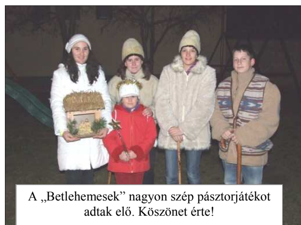
A „Betlehemesek” nagyon szép pásztorjátékot adtak elő. Köszönet érte!

A templom díszítéséről — ”Minden évben nagy élményt jelent számomra templomunk karácsonyi díszbe öltöztetése. Megható és különleges látvány, amikor plébános atya vezetésével meglett férfiak, családapák, nagypapák, szívük minden melegével készítik a Betlehemet, díszítik a karácsonyfákat. Isten áldja meg életüket és fizesse meg szolgálatukat az Ő nagy kegyelmével.” M I-né