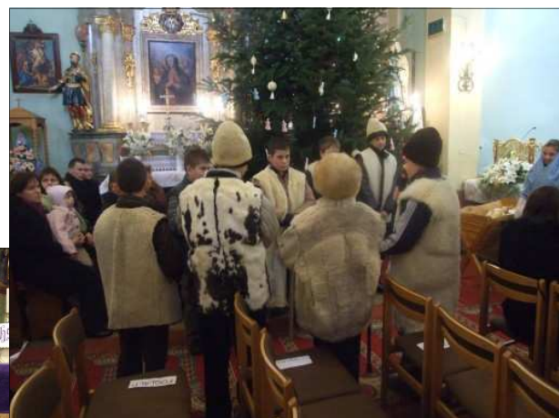
December 25-én, a „Pásztorok miséjén játszották el a gyerekek a karácsonyi történetet: Jézus születését. Köszönjük a gyerekeknek és felkészítőjének!

A templom díszítéséről — ”Minden évben nagy élményt jelent számomra templomunk karácsonyi díszbe öltöztetése. Megható és különleges látvány, amikor plébános atya vezetésével meglett férfiak, családapák, nagypapák, szívük minden melegével készítik a Betlehemet, díszítik a karácsonyfákat. Isten áldja meg életüket és fizesse meg szolgálatukat az Ő nagy kegyelmével.” M I-né