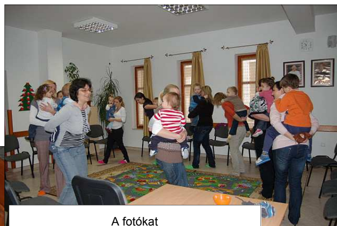
A fotókat Mészárosné Szlovicsák Erika készítette (és készíti) Köszönjük!