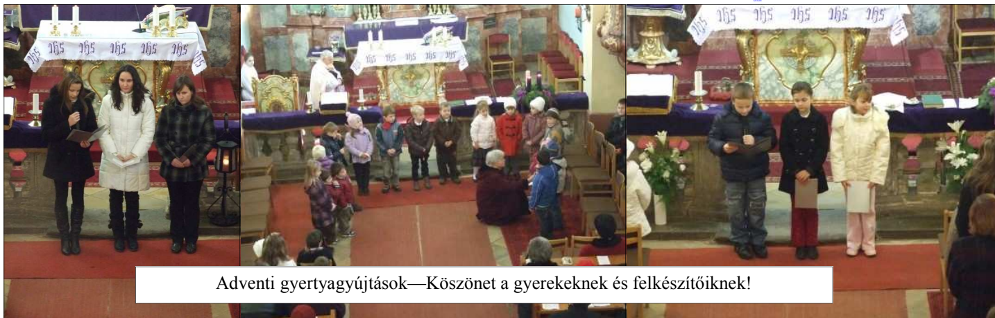
Adventi gyertyagyújtások—Köszönet a gyerekeknek és felkészítőiknek!