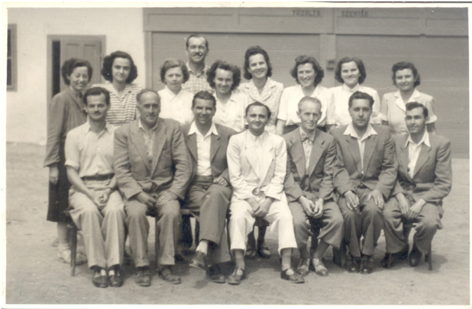
Az első „nagy” tantestület: 1951. VI. 17.

mindenben segítségükre kell lenni a gyermekek érdekében, mert csak így lesz eredményes az óvoda, iskola munkája.