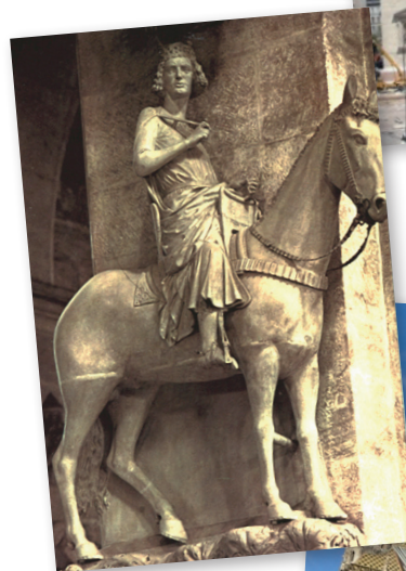
Istvánt ábrázoló bambergi lovasszobor