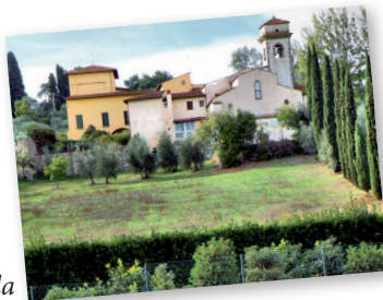
San Martino Mensola

Az Achent felkereső magyar zarándokok útba ejtették viszontagságos útjuk során a kölni Makkabeus templomot is, ahol a magyar szent királyok ereklyéit őrizték, sőt az idők folyamán képmásukat is elkészítették.