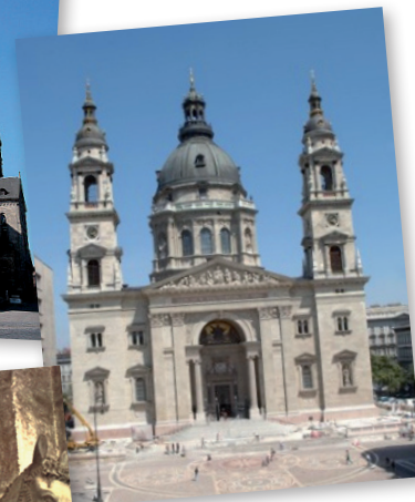
Budapest - Szent István-bazilika