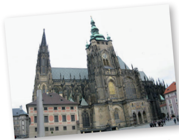
Szent Vitus székesegyház