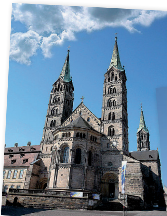
Bamberg - dóm