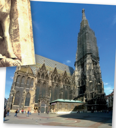
Bécs - Szent István-bazilika

A középkori szentkultusz egyik leghitelesebb fokmérője kétségtelenül és mindent kizáróan az adott szent előfordulásának gyakorisága a helynevekben és a templomcímekben. Ha áttekintjük a Kárpát-medence területén fennmaradt vagy mára elenyészett, ám oklevelekben említett helynévanyagot és egyházi templomcímeket, azaz patrocíniumokat, nyilvánvalóvá válik, hogy Szent István a középkori Magyarország egyik legjobban becsült és tisztelt szentje volt. Már 1083 után is szenteltek István tiszteletére templomokat, így a bakonybéli apátság 1086. évi birtokösszeíró levele már említi Borsodi (ma Borsód-pusztá) István tiszteletére szentelt kápolnáját.