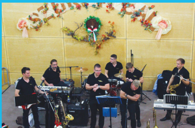
Varga Band zenekar