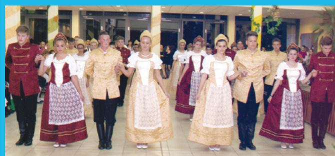
Palotástánchoz készülődő ifjaink