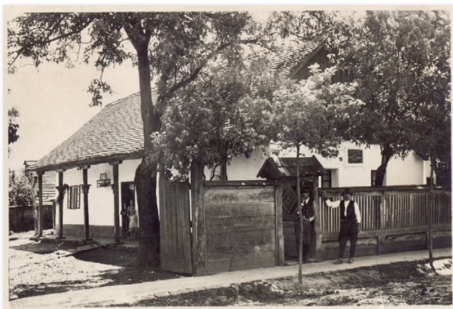
Arany János szülőháza Nagyszalontán