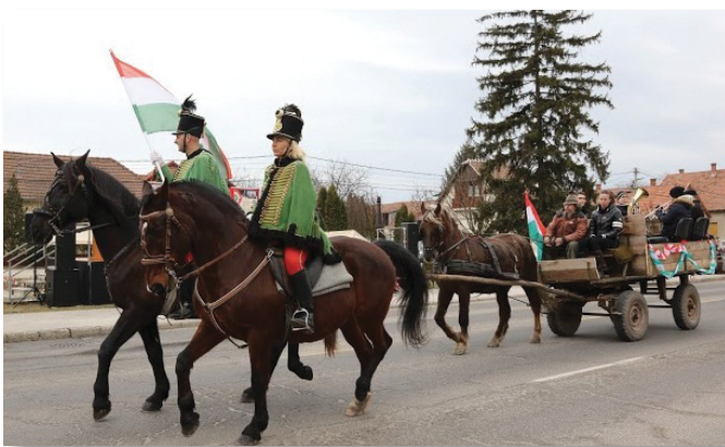
Huszárok vezetik fel az ünnepi menetet