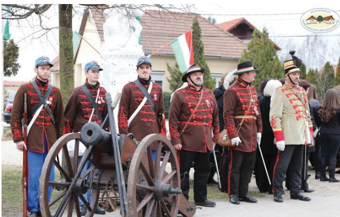
Dabasi Hagymányörző Honvéd Egyesület