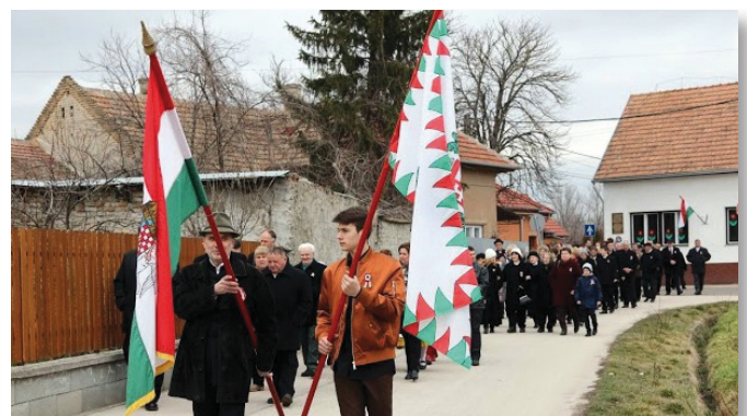
A Szentmise és az Istentisztelet után az ünneplő Némediek a Szabadság tere felé vonulnak