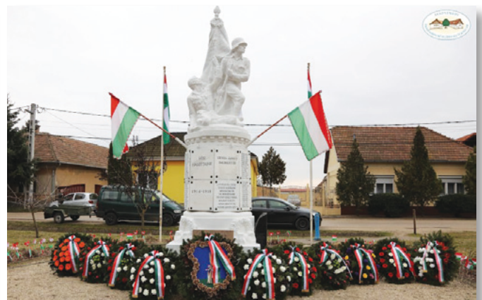
A megemlékezés koszorúja