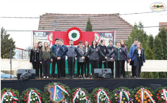
A 7. osztályosok ünnepi műsora