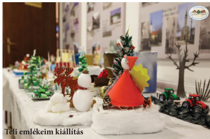
Téli emlékeim kiállítás