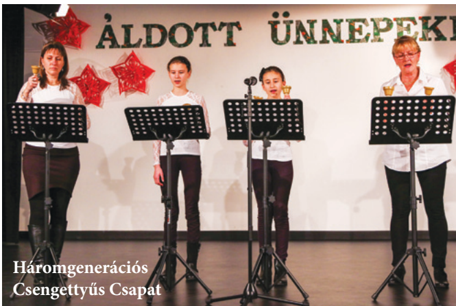
Háromgenerációs Csengettyűs Csapat