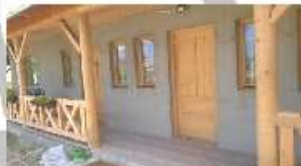
11:45- Új közösségi ház megáldása