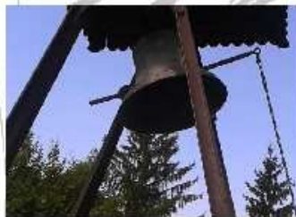
15:00 Új harang megáldása