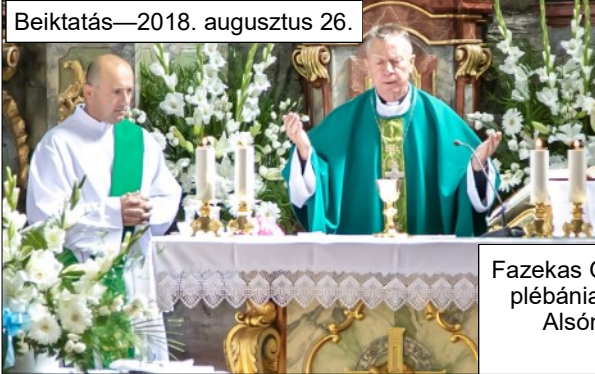
Beiktatás—2018. augusztus 26.