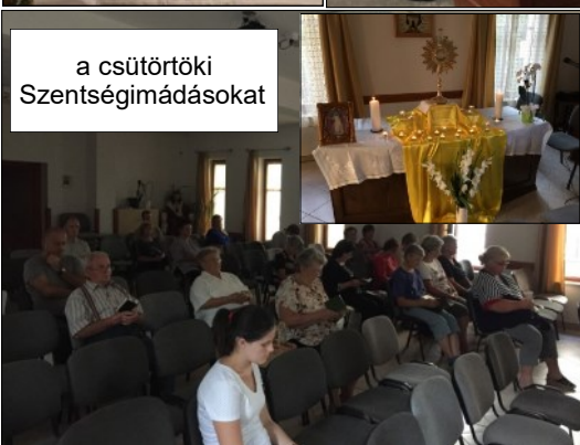
a csütörtöki Szentségimádásokat