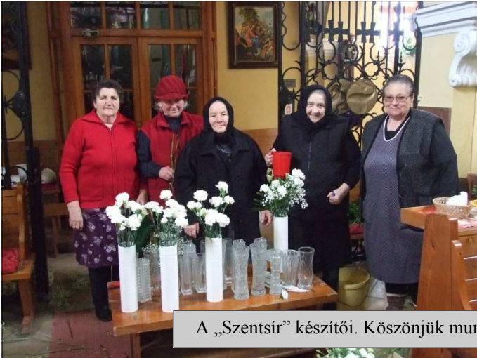
A „Szentsír” készítői. Köszönjük munkájukat!