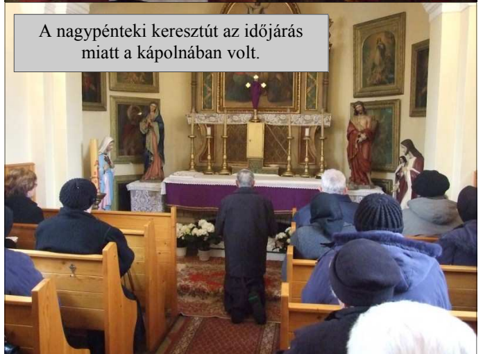
A nagypénteki keresztút az időjárás miatt a kápolnában volt.