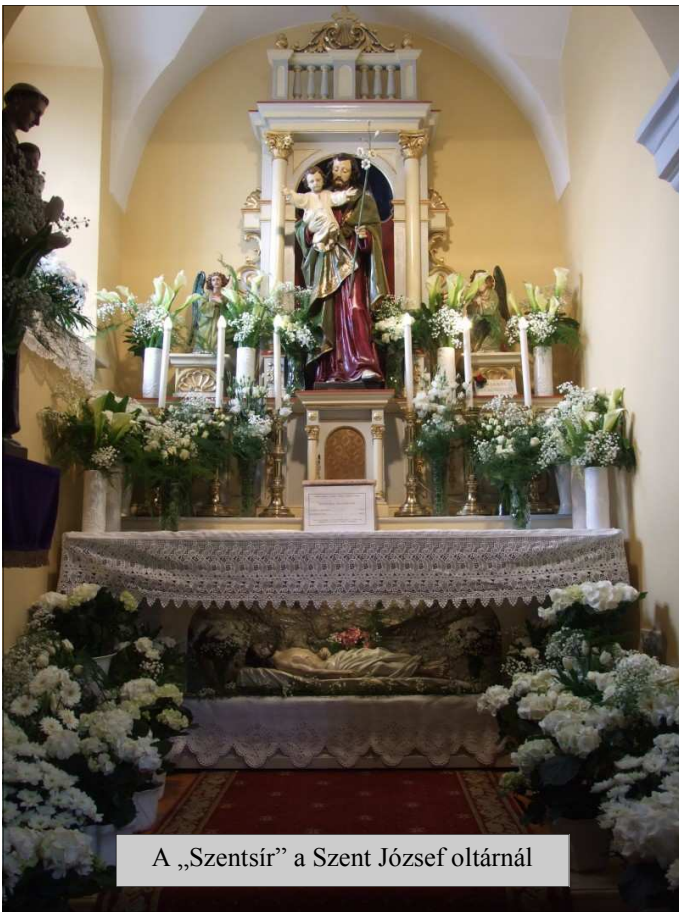
A „Szentsír” a Szent József oltárnál