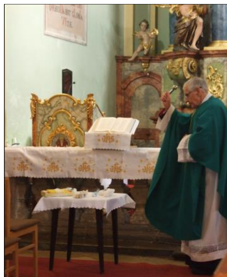
„Ki negyven nap előtt üdvösségünkre...” Gyertyaszentelés