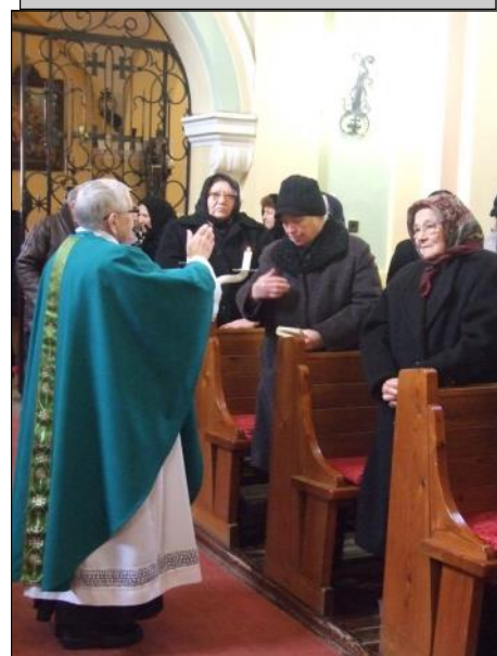
„Emlékezünk Szent Balázsrá...” Balázs-áldás