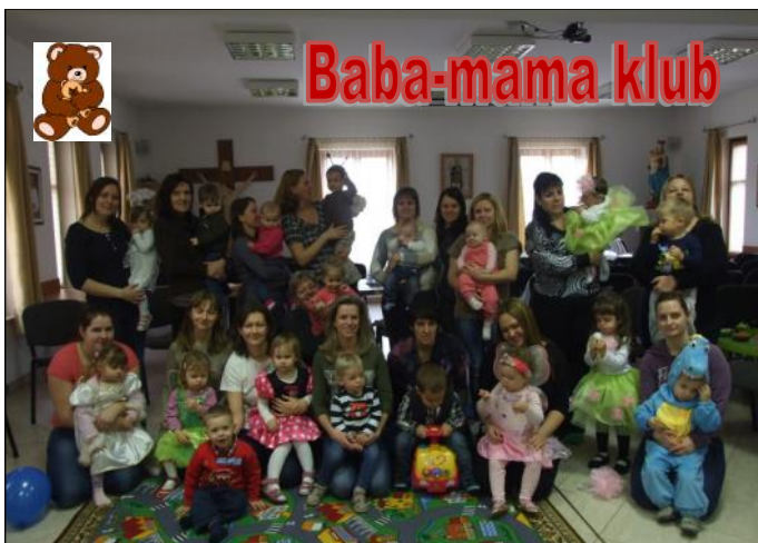
A Baba-mama klubban február hónapban „farsangi bált” tartottak.