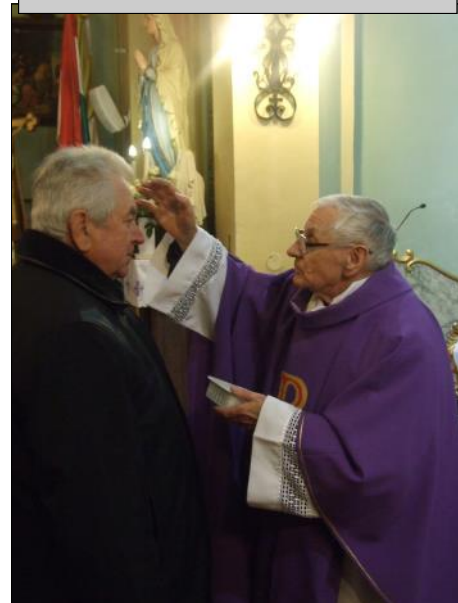
„Hamvazkodjál hívó lélek...” Hamvazás