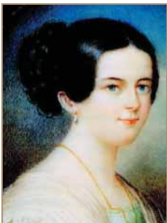
gr. Széchényi Istvánné, Seilern Crescence

1791. szeptember 21. – Döbling, 1860. április 8.) politikus, író, polihistor, közgazdász, a Batthyány-kormány közlekedési minisztere. Esméi, tevékenysége és hatása által a modern, új Magyarország egyik megteremtője. A magyar politika egyik legkiemelkedőbb és legjelentősebb alakja, akinek nevéhez a magyar gazdaság, a közlekedés, a külpolitika és a sport megreformálása fűződik. Számos intézmény alapítója és névadója.