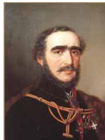
gr. Széchényi István

Első ilyen irányú terve a lóverseny meghonosítása volt, amit Ausztriában és Magyarországon ekkor még nem ismertek. Ennek a kezdeményezése több támogatóra is lelt, ezért megbeszélésre indult I. Ferenc királyhoz, akinek a felszólítására