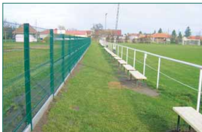
A felújítást követően

rámpa is készült az épületekhez való akadálymentes eljutáshoz. A világítás korszerűsítése és gazdaságosabbá tétele érdekében a meglévő, elavult, rossz hatásfokú wolframszálas fényforrásokat nagynyomású fém halogén lámpatestekre cserélték. A kivitelező cég elvégezte a leamortizálódott padok cseréjét is. Reméljük, a megvalósult fejlesztések hozzájárulnak ahhoz, hogy szívesebben látogassák az alsónémedi sporteseményeket, és egyéb - a sportpályán tartandó - rendezvényeket!