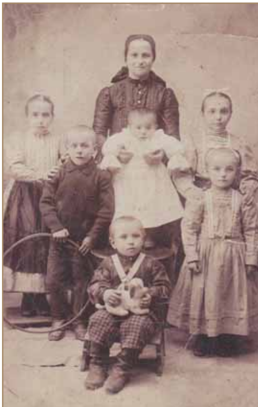
Ismeretlen némedi család