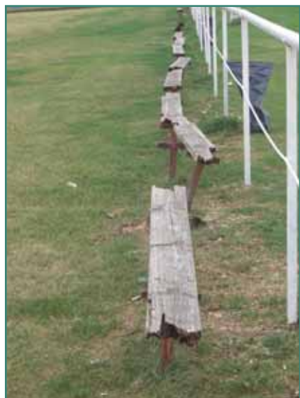
A felújítás előtt

A sportpálya legsürgősebben fejlesztésre szoruló része a kerítés megépítése volt, mivel a létező kerítés biztonságát, jó állapotának fenntartását is veszélyeztette a kerítés hiánya.